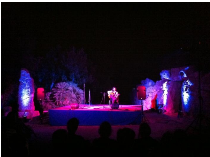
Actuació Gaizca Baena a Ses Païsses

Aquest any han vingut aproximadament 1.796 persones, per tant hem tingut més públic que l'any passat.