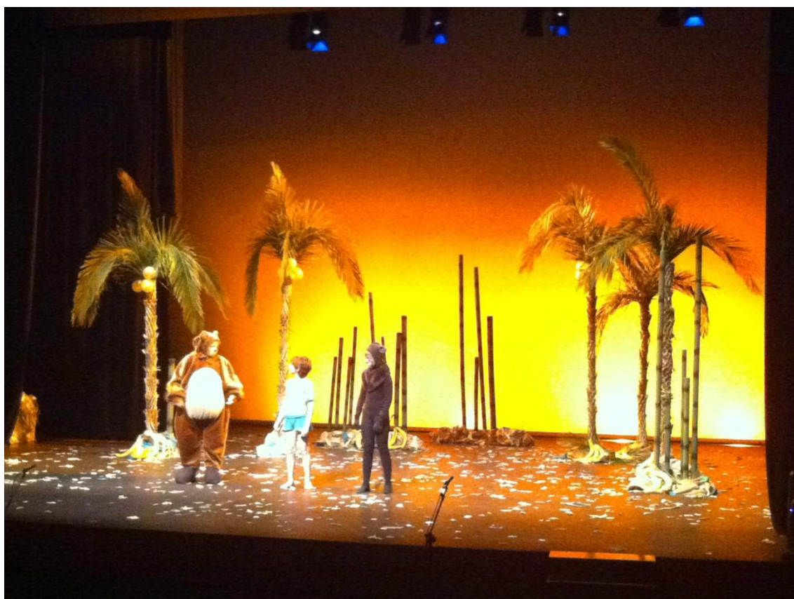
“Una història de la selva” del col·legi Sant

Degut a la manca de pressupost, aquest any no es va fer cap camiseta, ni element commemoratiu. Tampoc no es va convidar a gelat als participants.